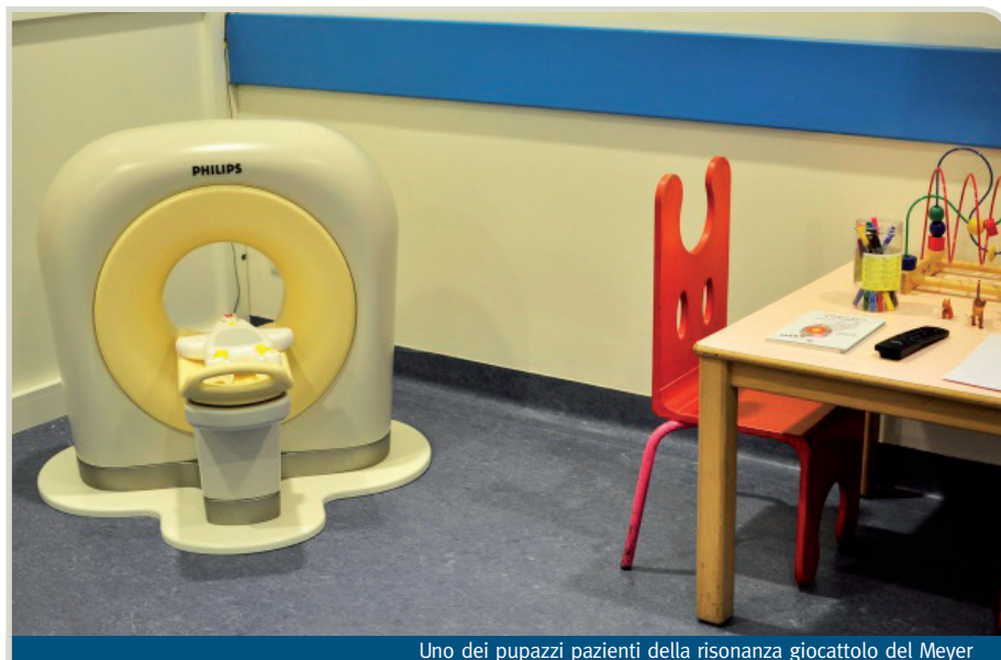
Uno dei pupazzi pazienti della risonanza giocattolo del Meyer

Ogni anno, l'8 novembre – in omaggio alla data in cui il fisico tedesco intuì la portata rivoluzionaria dei misteriosi raggi osservati nel suo laboratorio - si celebra la Giornata mondiale della radiologia: questa volta, la ricorrenza è dedicata all'ambito pediatrico, il primo in cui la disciplina, grazie anche al giovane pattinatore infortunato, ha trovato applicazione. In quest'arco di tempo, la radiologia ha affrontato una lunga evoluzione, con il progressivo abbandono delle radiazioni ionizzanti e del rischio biologico che il loro utilizzo comportava soprattutto per i pazienti più piccoli. Per osservare l'interno del corpo umano, si è pensato di sfruttare altre forze fisiche: prima gli ultrasuoni con le ecografie, ora i campi magnetici con la risonanza magnetica, uno strumento fondamentale per la diagnosi di molte patologie. Con un unico inconveniente: pur essendo un esame assolutamente indolore, non è facile convincere i bambini a restare fermi per più di trenta minuti all'interno di quel tubo, lungo e stretto, che può provocare sensazioni claustrofobiche. I macchinari di ultima generazione, come la Risonanza magnetica 3 Tesla acquisita grazie al sostegno della Fondazione Meyer, consentono di ridurre di molto i tempi di forzata immobilità. Ma spesso, per