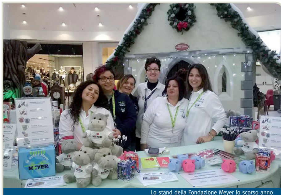
Lo stand della Fondazione Meyer lo scorso anno

Vi aspettiamo come ogni anno al Centro Commerciale I Gigli, in corte Tonda, per scegliere insieme un Natale più autentico e ricco di significato. La raccolta fondi di quest'anno sarà destinata a supportare le attività della ludoteca dell'Ospedale Meyer. La ludoteca è uno spazio dove il bambino, seppure nella difficile esperienza del ricovero, resta tale, con la possibilità di giocare e mantenere la sua dimensione di gioco e crescita educativa attraverso laboratori e attività che lo coinvolgono direttamente. Ogni giorno, anche la domenica, pedagogisti a livello professionale seguono le varie attività e si spostano anche nei reparti per i piccoli che non possono lasciare il proprio letto. L'elevata qualità della cura e