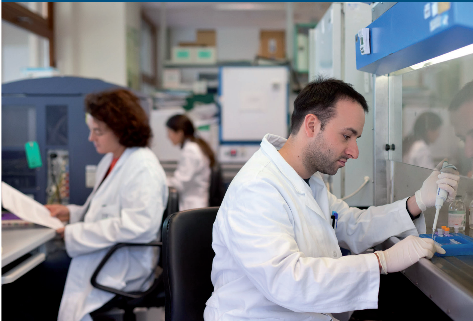
Il laboratorio degli screening