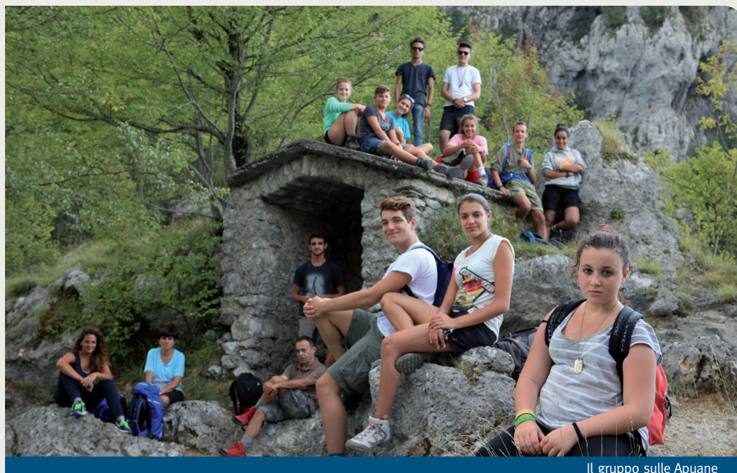
Il gruppo sulle Apuane

Profondamente immerso in tutto questo c'è il diabete. La narrazione della malattia, in questo documentario fortemente voluto dalla Fondazione e curato dal suo neonato Centro Studi, scorre in filigrana. Attraversa l'intera pellicola con discrezione e conduce gli spettatori nel mondo di chi, come questi quattro ragazzi, ogni giorno è alle prese con l'insulina, le “ipo” (-glicemie), gli aggiustamenti alla vita quotidiana, i piccoli immensi problemi di accettazione sociale e le ansie di avere il fardello di una malattia cronica. Tutto questo miscelato al fatto di trovarsi nel bel mezzo di un'età complicatissima,